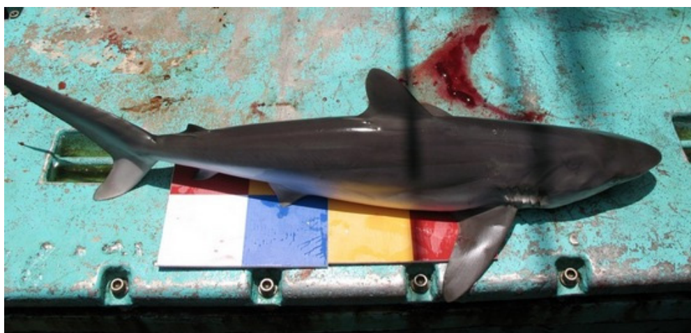
平滑白眼鯊（黑鯊）Silky shark ( Carcharhinus falciformis )

污斑白眼鯊特徵：尾鰭下葉短，上下葉不對稱，具臀鰭，眼小，部分鰓裂在胸鰭上方，第一背鰭及胸鰭末端鈍圓。