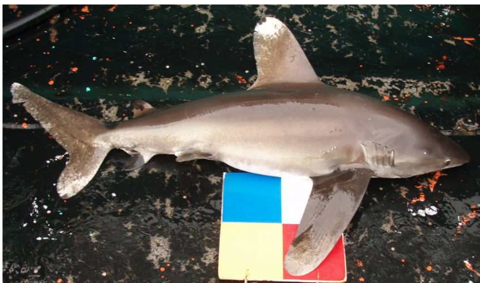
污斑白眼鯊（花鯊）Oceanic whitetip shark ( Carcharhinus longimanus )

污斑白眼鯊特徵：尾鰭下葉短，上下葉不對稱，具臀鰭，眼小，部分鰓裂在胸鰭上方，第一背鰭及胸鰭末端鈍圓。