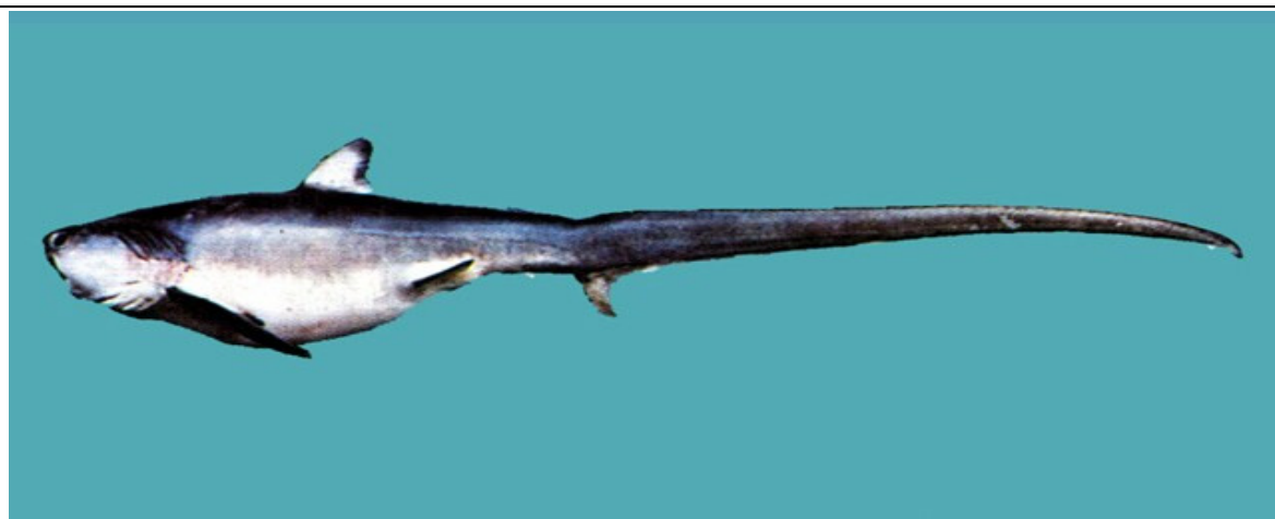
狐鯊（長尾鯊）