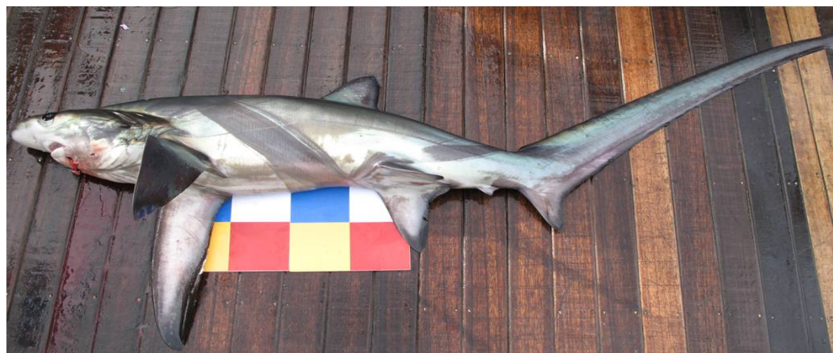
深海狐鮫（大目午仔、鯊娘仔）