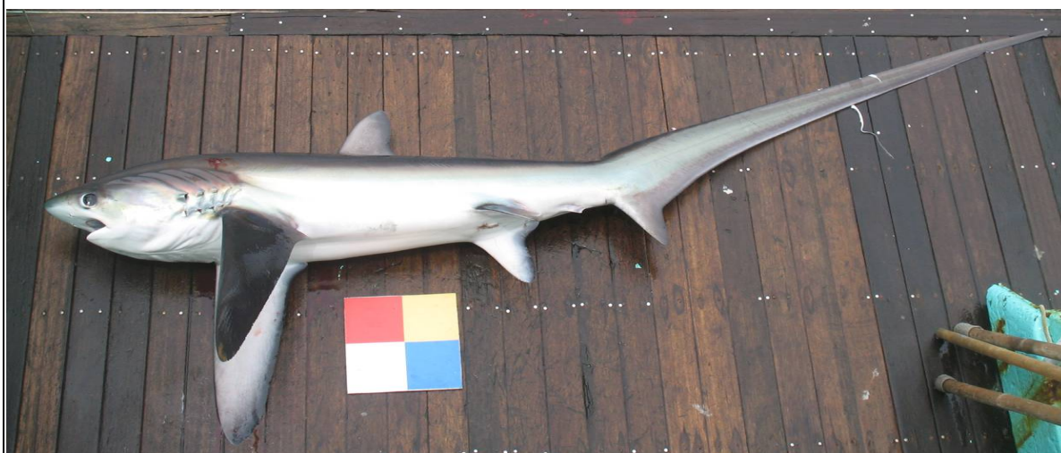
淺海狐鮫（小目午仔、鯊娘仔、午仔）