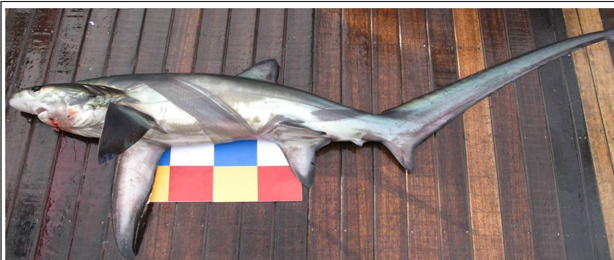
深海狐鯊（大目午仔、鯊娘仔）