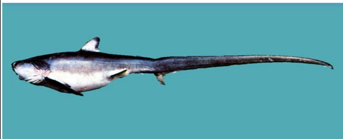
狐鯨（長尾鯊）