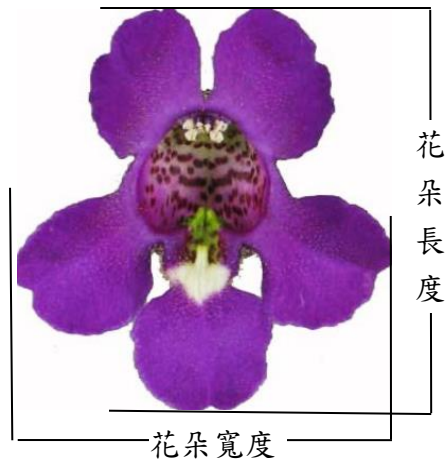
▲圖四、性狀 12、13：花朵長度、花朵寬度