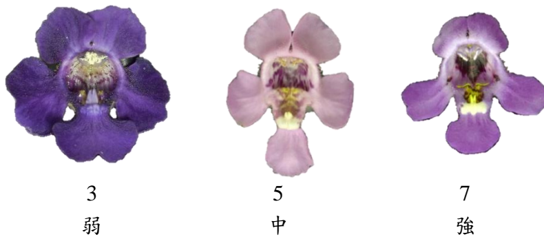
▲圖六、性狀 25：下花冠唇瓣裂片邊緣波浪程度