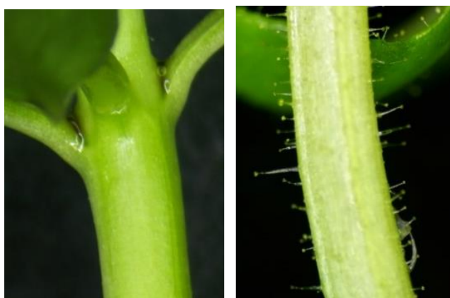
▲圖二、性狀 5：莖毛有無