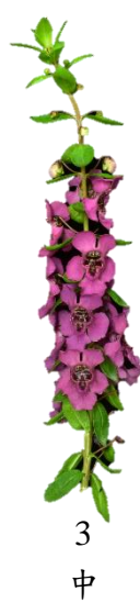
▲圖三、性狀 11：花序密度