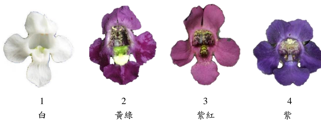
▲圖九、性狀 31：三十蜜腺凹陷處主要顏色