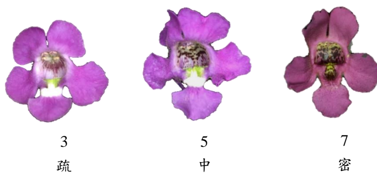
▲圖八、性狀 30：斑點密度