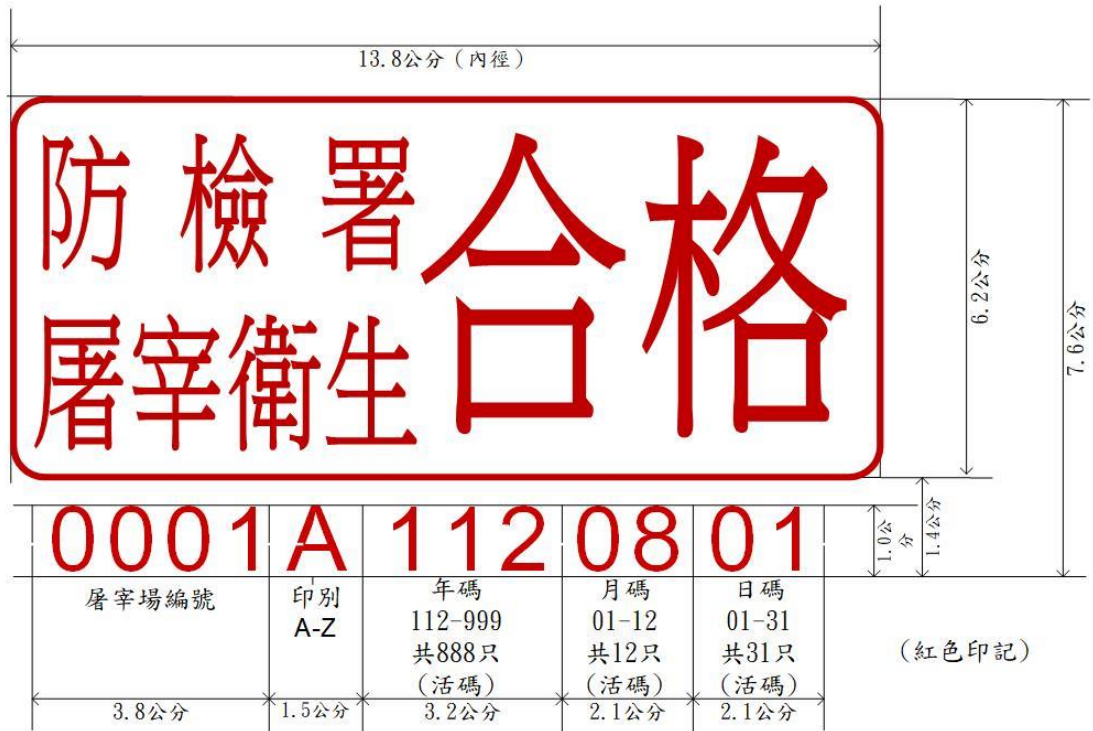
甲式屠宰衛生檢查合格標誌