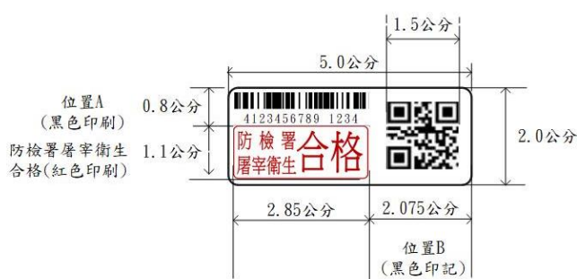
丙式屠宰衛生檢查合格標誌