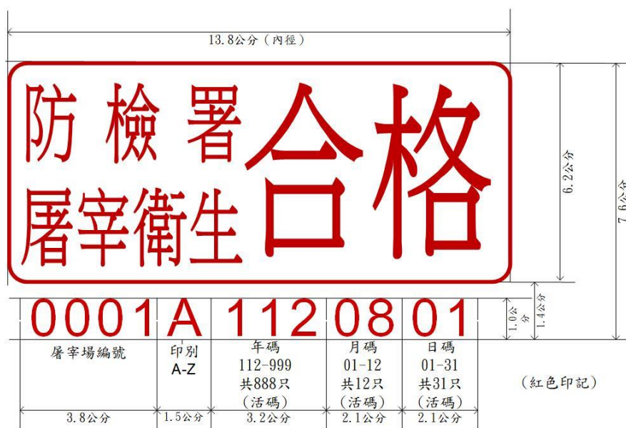
甲式屠宰衛生檢查合格標誌

註： 1. 比例 1：1 2. 本標明方法中華民國一百一十二年八月十一日修正生效前已製作之甲式、乙式標誌，得使用至一百一十二年十一月三十日。