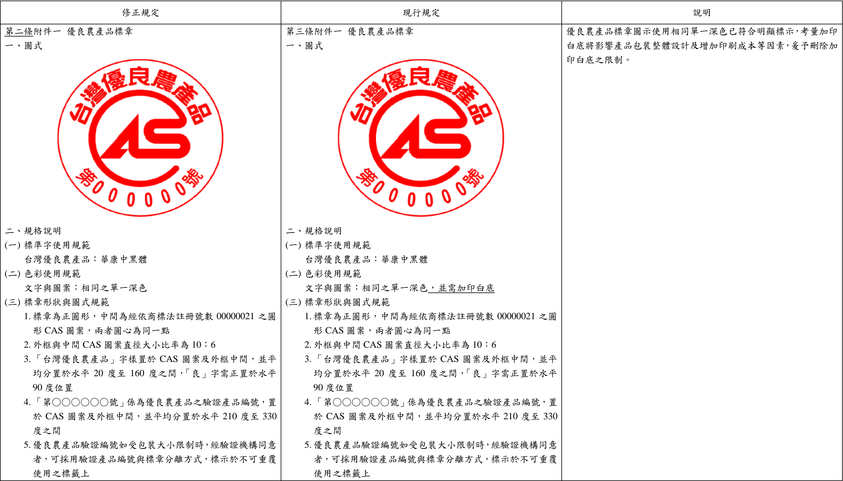
農產品標章管理辦法第三條附件一修正對照表