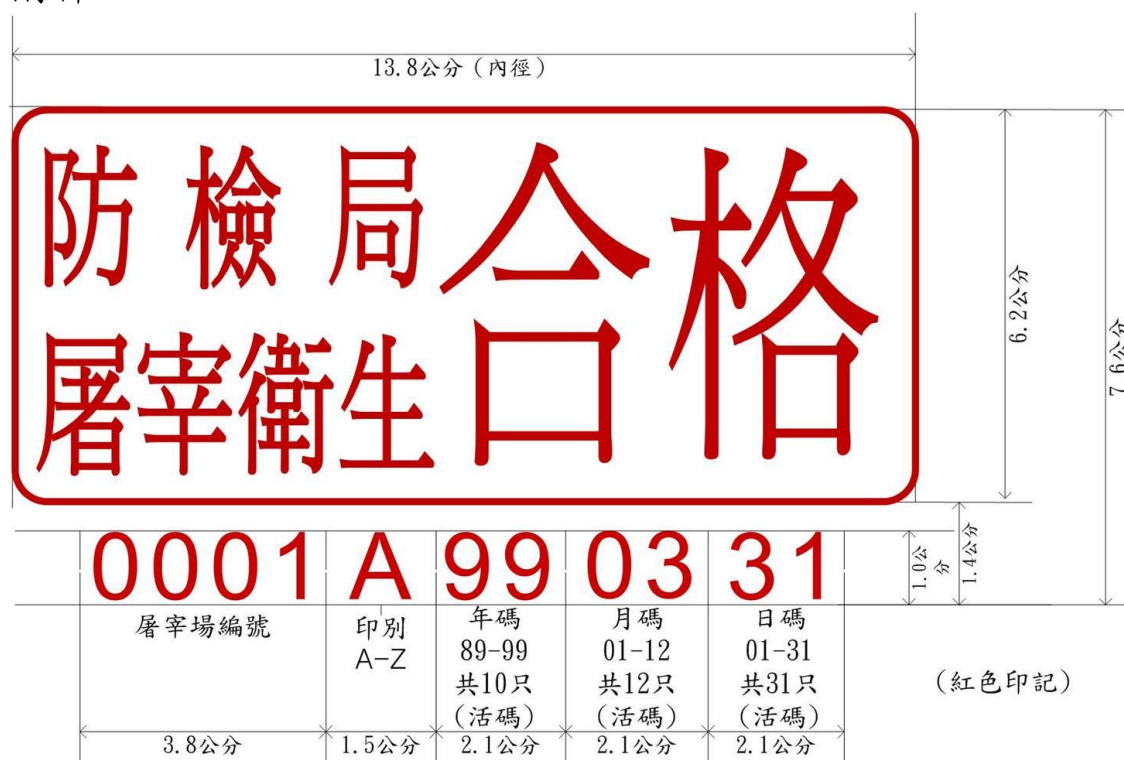
甲式屠宰衛生檢查合格標誌