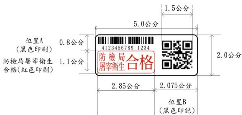
丙式屠宰衛生檢查合格標誌